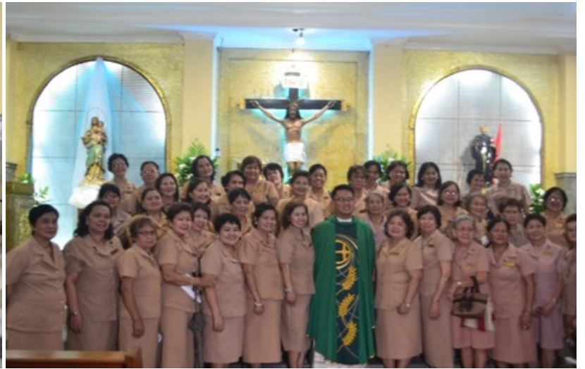
Nagsagawa ng Installation sa mga bagong kasapi ang Mother Butler Guild ng SGP