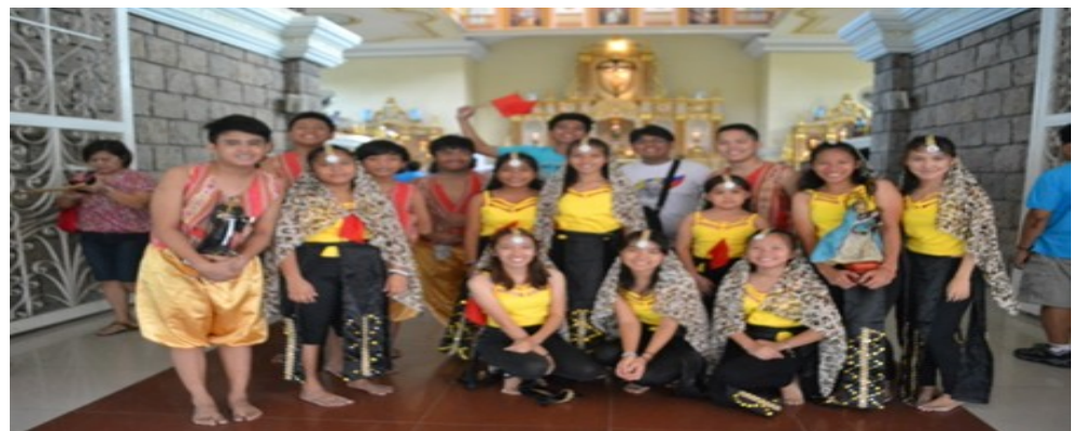
Nakiisa ang parokya sa isinagawang Walk for Peace with Mary noong Setyembre 5, 2015. Nagmula sa Immaculate Cathedral patungong Sta. Clara de Montefalco, Caniogan, Pasig.