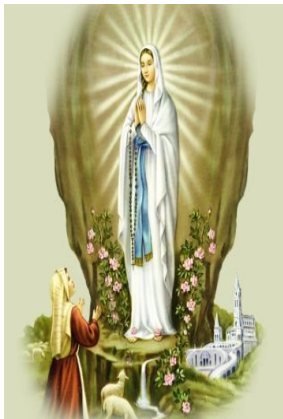
On the Feast of Our Lady of Lourdes 2018