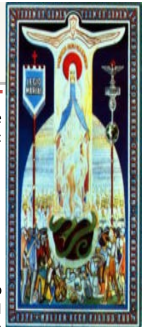
Ang Catena Legionis ay dinadasal ng mga legionaryo araw-araw. Ito ang awit ng papuri ni Maria para sa Diyos noong Anunsasyon.

SHARED. And like the bread when it became the Body of Christ, we too are being shared into the world. Blessed and broken (tested) we are now ready to embark into the world and share the Good News to everyone. And as we go through this journey, Mary accompanies us. She never leaves us. She is there in our consecration, she's there at our carrying of our cross. And she is there as we are transformed to be part of the Body of Christ!