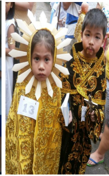
Ang taunang HOLY WIN PARADE sa pamumuno ng Knights of Columbus sa pakikipagtagulungan ng Parish Youth Ministry na ginanap noong ika-31 ng Oktubre 2014