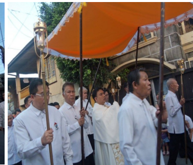
Ang pagdiriwang ng Kristong Hari noong ika-23 ng Nobyembre 2014 na sinimulan ng Banal na Oras at sinundan ng prusisyon sa ika-3 ng hapon.