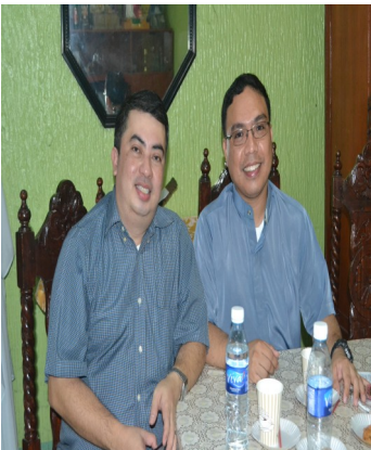
LITURGICAL SEMINAR-PAKIKIISA NG LAYKO SA EUKARISTIYA October 11, 2014