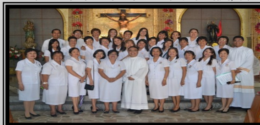
RENEWAL AND INSTALLATION OF LECTORS & COMMENTATORS Dec. 29, 2013