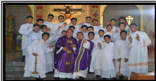
INSTALLATION OF MINISTRY OF ALTAR SERVERS—Dec. 15, 2013