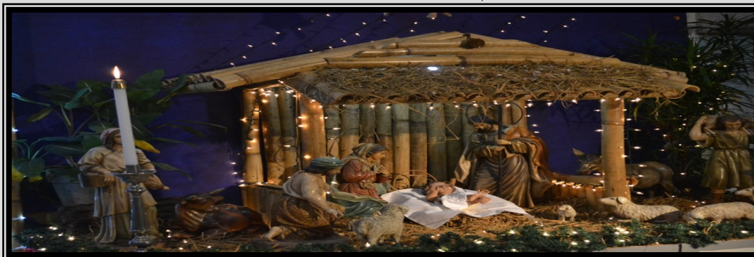
BELEN SA PAROKYA NG SAN GUILLERMO