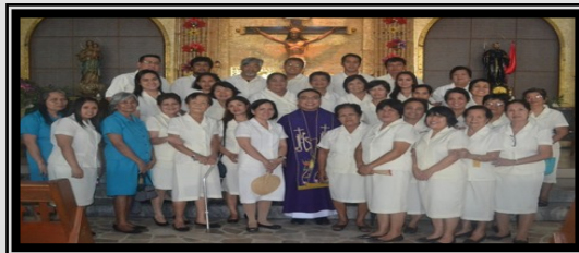
INSTALLATION OF USHERS AND USHERETTES—Dec. 22, 2013