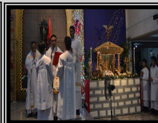
CHRISTMAS VIGIL MASS—DEC. 24, 2013